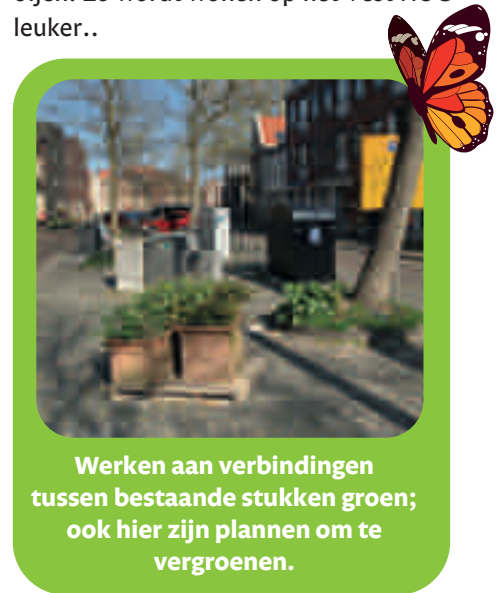
Werken aan verbindingen tussen bestaande stukken groen; ook hier zijn plannen om te vergroenen.

Wat ik ontzettend leuk vond aan dit project (en dat klinkt misschien wat